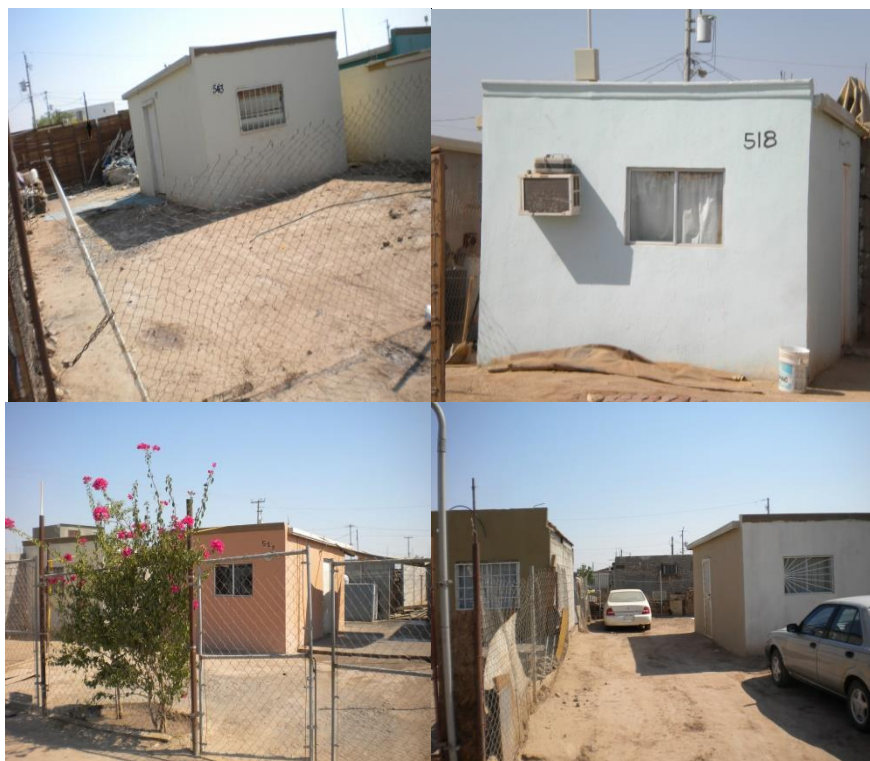
Figura 4. Viviendas sin ampliaciones.