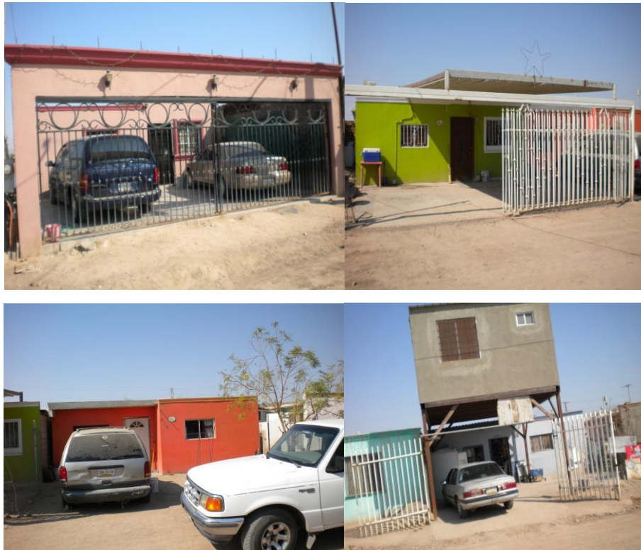
Figura 5. Viviendas con ampliaciones.

Pues, me entregaron un cuarto nada más y el baño, y pues construimos dos cuartos grandes, mi tienda y pues para arriba tiene para las escaleras y pues espero, espero seguir, seguir adelante para, para que mis hijos se sientan más cómodos (Lupita).