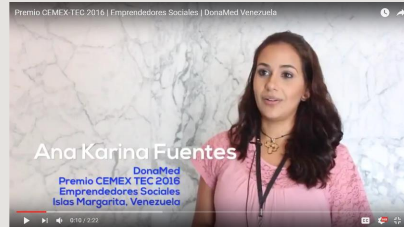
Proyecto DonaMed Venezuela, ganador de Emprendedores Sociales.