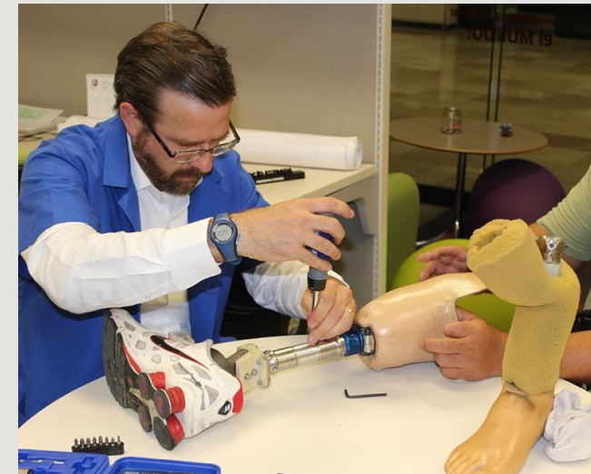
Proyecto: Tecnología de prótesis a bajo costo. -Jalisco, México