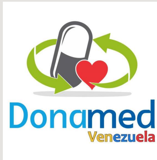
Proyecto: Donación de medicamento. -Caracas, Venezuela