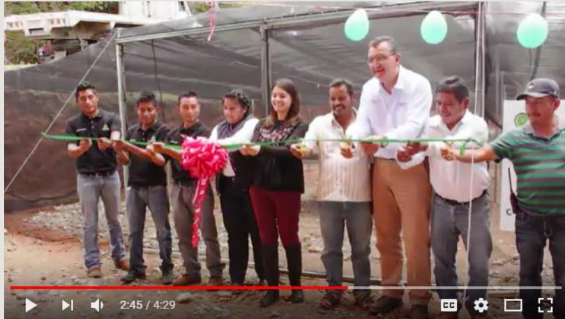
Proyecto Construyendo un Vivero, ganador de Transformando Comunidades.

Da clic a las imágenes para ver los videos.