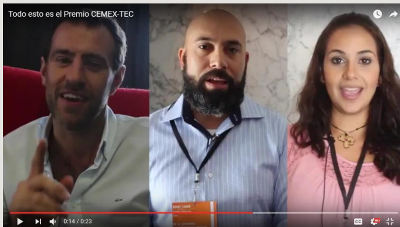
¡El Premio CEMEX-TEC es de TODOS!