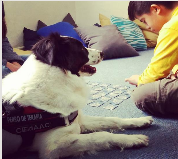
Proyecto: Lectura asistida con perro. -Chihuahua, México

Educación | Tecnologías Sociales | Salud | Medio Ambiente | Inclusión