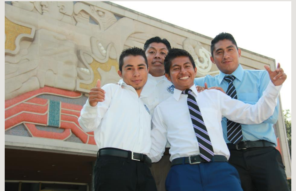
Equipo Ganador, Edición 2016, Transformando Comunidades.

* El equipo de estudiantes conservará la autoría en todo momento y serán líderes de la ejecución.