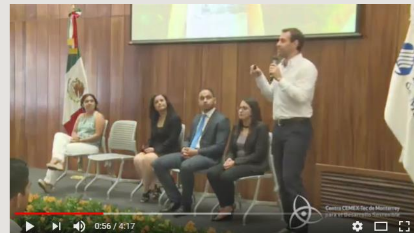
Ceremonia de premiación 2016.